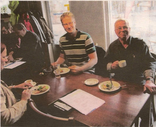
Kevätkokous pidettiin 15.4.