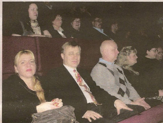
Klaukkalan Yrittäjät kävivät katsomassa Helsingin Kaupungin teatterissa Salaa rakas 11.2. Nordea Nurmijärven vieraana.